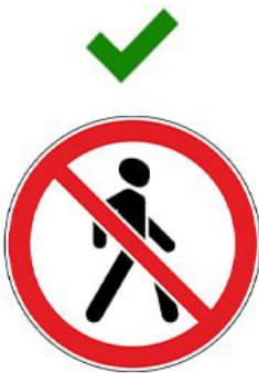
Движение пешехода запрещено